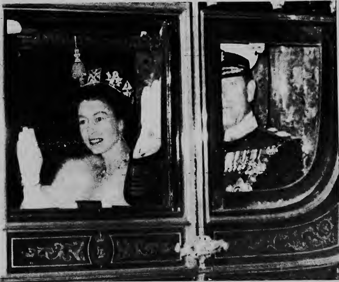
LONDON -- Reina Elizabeth y Principe ta saluda pueblo mientras cu nan ta recorrer Londres na nan caminda pa habri e sesion parlamentario nobo. E reina a tene un discurso den Parlamento.

Oranjestad San Nicolas Tel 1145 tel. 5635